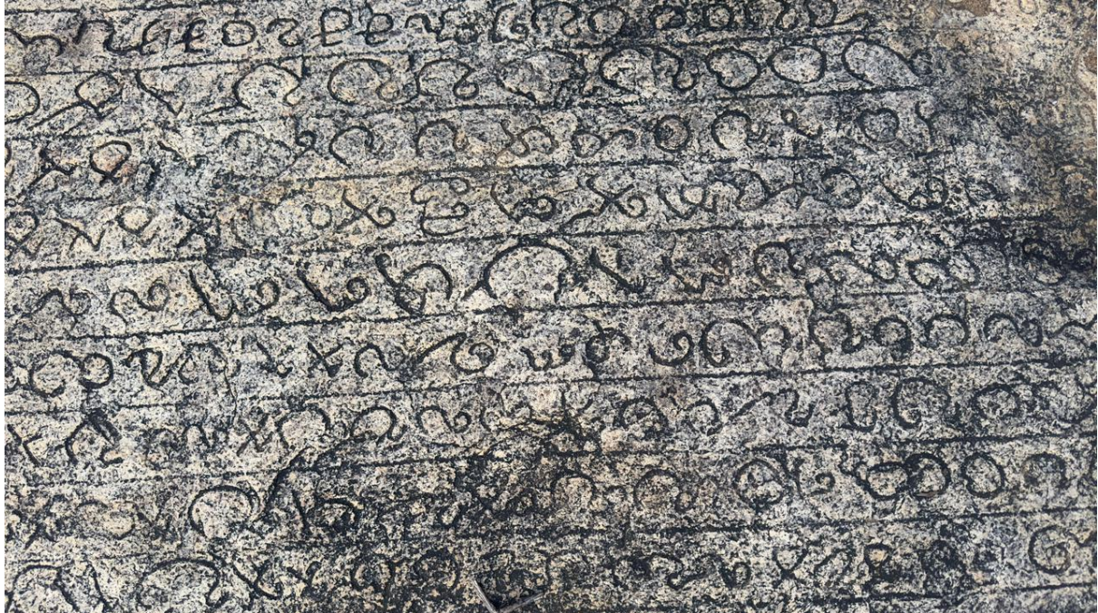
Stone Inscription in Periyakulam tank