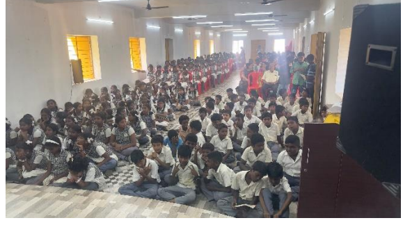
Ringeltoube School, Mylaudy