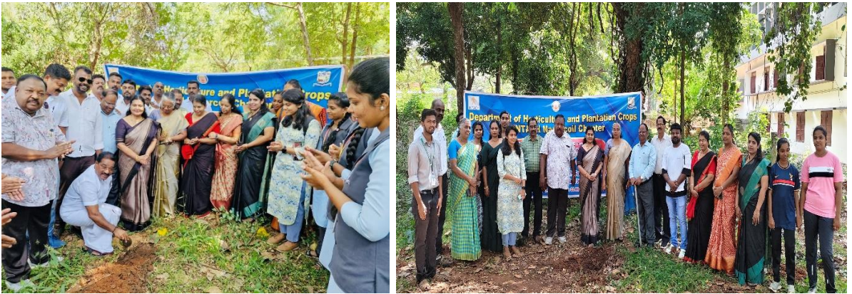
Palmyra tree planting on 29.10.2024