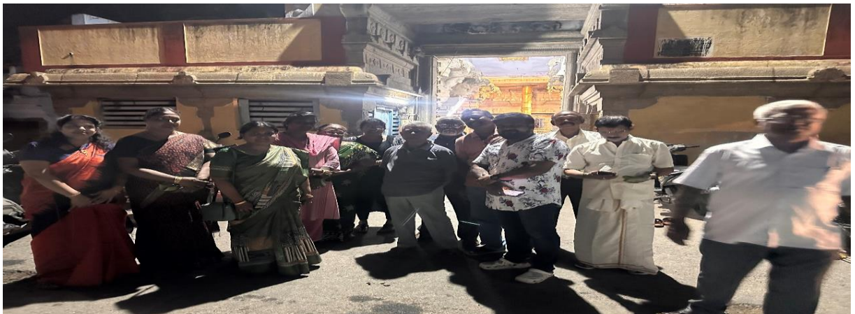
Parakkai Mathusoothana Perumal koil